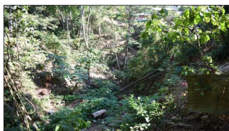
FOTO 02: Vista de taludes erosionados en peligro inminente de deslizamientos y colmatado de la quebrada Canalhuaycco.