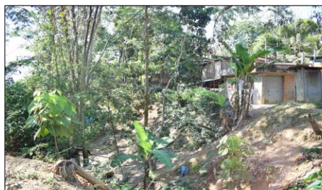
FOTO 01: Vista de viviendas a orillas de la quebrada Canalhuaycco, en peligro latente de deslizamientos de taludes.