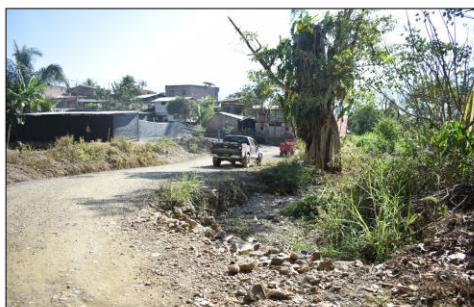
FOTO 03: Vista del lecho de quebrada Canalhuaycco, junto a vía vecinal de la localidad de Canal